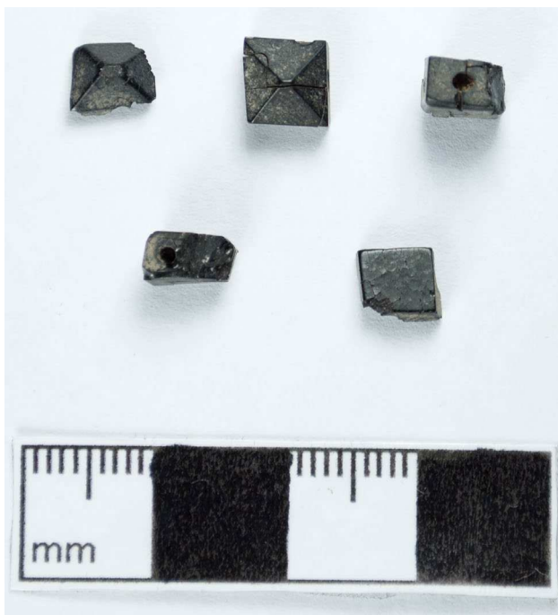
Figura 5. Cuentas europeas hechas de material azabache.

europas, de concha y de vidrio, en los entierros, especialmente en una iglesia, es ilustrativo y evidencia algunas semejanzas entre los entierros de Chotuna y de Mocupe Viejo.