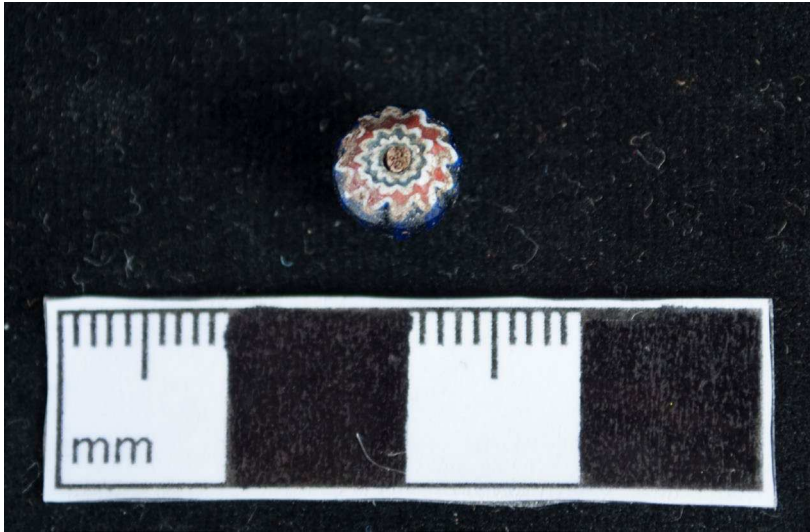
Figura 3. Cuenta europea de vidrio, Chevron, del sitio de Magdalena de Cao Viejo.