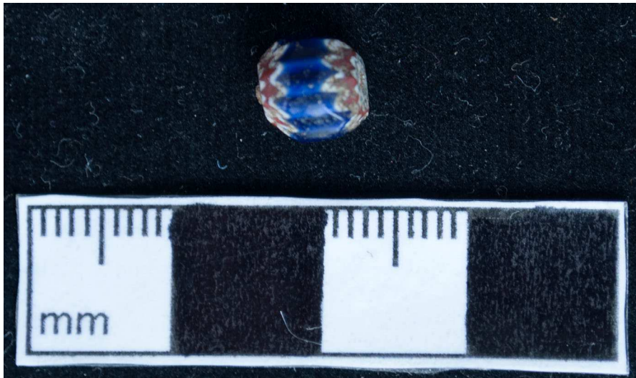
Figura 4. Cuenta europea de vidrio, Chevron, del sitio de Magdalena de Cao Viejo.

usadas para evocar memorias y asociaciones significantes para construir identidades coloniales tempranas» (Loren 2008: 104). Sin embargo, es muy reveladora la recuperación de cuentas de concha de Spondylus y cuentas europeas en los mismos contextos arqueológicos. Por lo tanto, en este entorno colonial, las cuentas de conchas de Spondylus y europeas en vestimenta fueron fundamentales para construir identidades en ambas formas familiares y nuevas. Sin embargo, las cuentas eran más que objetos de adorno para los vivos; también adornaron a los muertos, lo cual nos permite examinar sus usos en las prácticas funerarias y la cosmología andina.