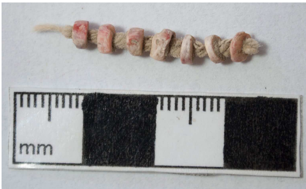
Figura 2. Cuentas de Spondylus todavía con hilo preservado, procedentes del sitio de Magdalena de Cao Viejo.

Loren 2008). Las cuentas demostradas como vestidura o joyas caracterizaban el poder social para que el individuo se definiera a sí mismo de cierta manera y para poder convencer a los otros de cómo actuar hacia sí, lo cual es planteado, de manera similar, por Earle (1994) en torno a los materiales de prestigio inca (D'Altroy 2002; Graeber 1996: 18-19). En la costa norte, los proyectos arqueológicos de VanValkenburgh y Magdalena de Cao Viejo de Quilter, grandes cantidades de conchas Spondylus y cuentas europeas fueron recuperadas arqueológicamente por medio de prospección y excavaciones.